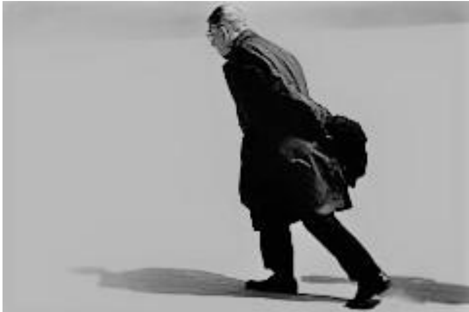
Les Boréales. 2013-2014