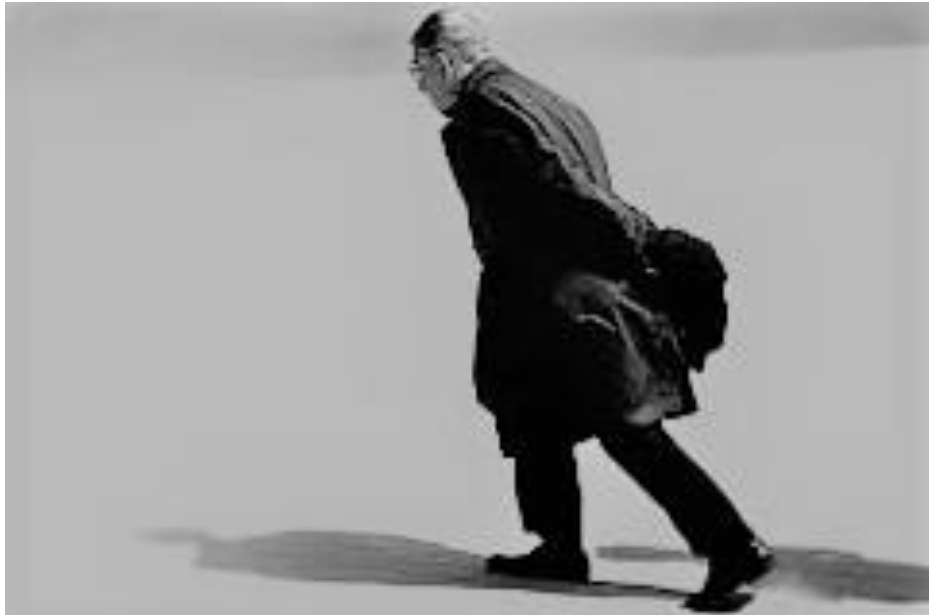
Antanas Sutkus. Les Boréales. 2013-2014