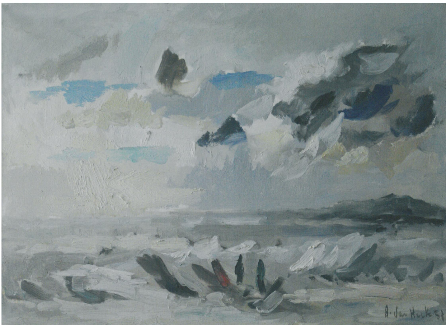
PAGE DE GAUCHE : MER DU NORD - POISSONS. PAGE DE DROITE : ENCADRÉ - DÉTAIL EN BAS : PORT DE GRAVELINES COLLECTIONS PARTICULIÈRES.