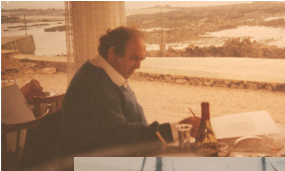
PAGE DE GAUCHE : PHOTO D'ARTHUR VAN HECKE DESSOUS : SANS TITRE. COLLECTIONS PARTICULIÈRES. PAGE DE DROITE : COUCHER DE SOLEIL. DESSOUS : MARINE. TÊTE DE PÊCHEUR. COLLECTIONS PARTICULIÈRES.